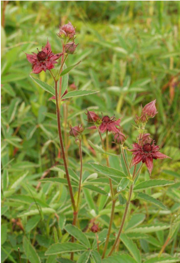
De waterardbei is een vaste plant uit de rozenfamilie. Hij bloeit in juni en juli.